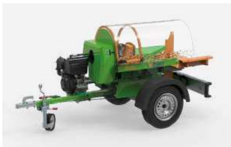
Le châssis routier (article n° SBL), pour transporter Polly facilement.

En option, Polly est également disponible avec un attelage à trois points ou un châssis — pour une utilisation flexible en dehors de la maison et de la cour.