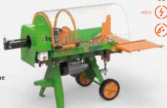
Polly E5, 5-R