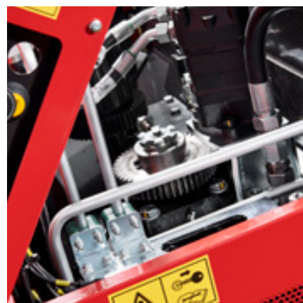
Danfoss hydraulische motor