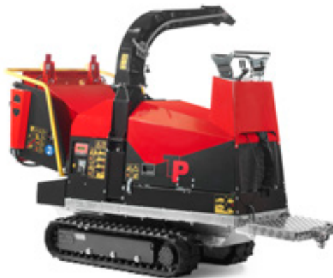
Handmatige bediening en platform