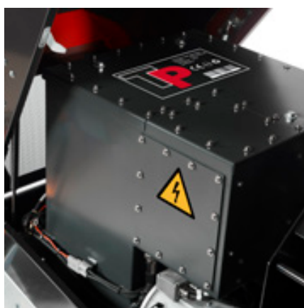
Krachtige 44 kWh accu