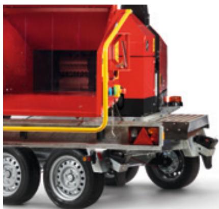
Mechanisch draaiplateau 225°