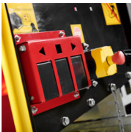
TP Easy Control met Reset – Reserve – Go-functie