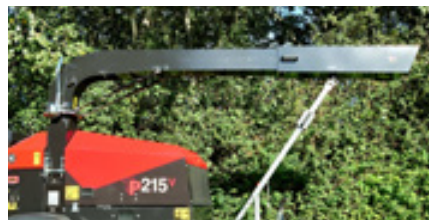
Telescopische uitloop is een optie

De TP 215 Mobile kan precies aan uw wensen worden aangepast, of u nu enkele of dubbele assen, een rechte of in hoogte verstelbare dissel, een vaste uitloop, de in hoogte verstelbare TP Vario uitloop, een hydraulische lier of telescopische uitloop nodig hebt