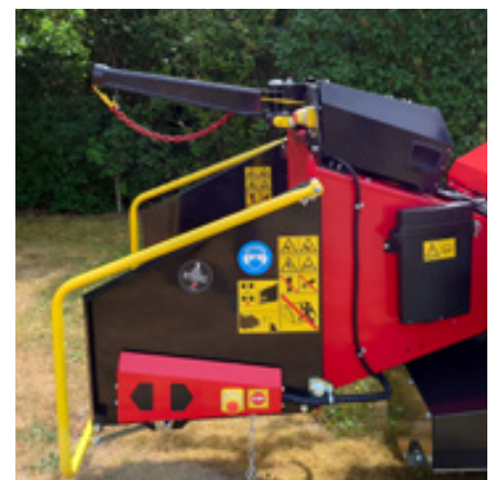
Een hydraulische lier is een optie voor alle TP 215 mobiele en rupsbandmodellen