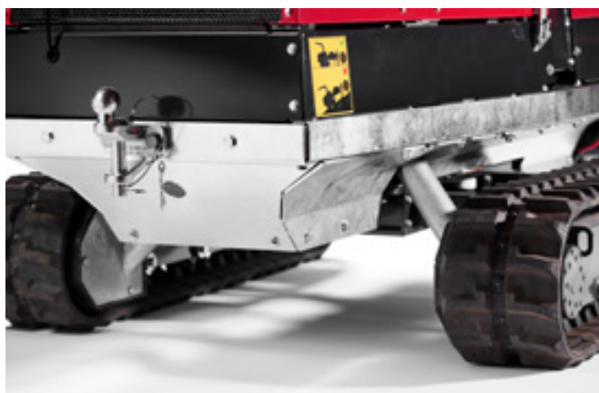
Bodemvrijheid van 200 mm, eenvoudig onderhoud en versterkte slangbescherming. Variabele breedte 1.150-1.350 mm