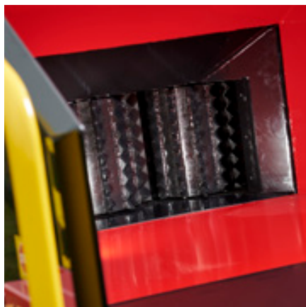
Verticale invoerrollen van TP Forest Design

De TP 280 Mobile is een "inliner". Dankzij de verschillende mogelijkheden voor het onderstel en de dissel, kunt u de TP 280 Mobile naar wens uitrusten.