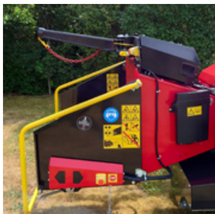
Hydraulische lier (optioneel)