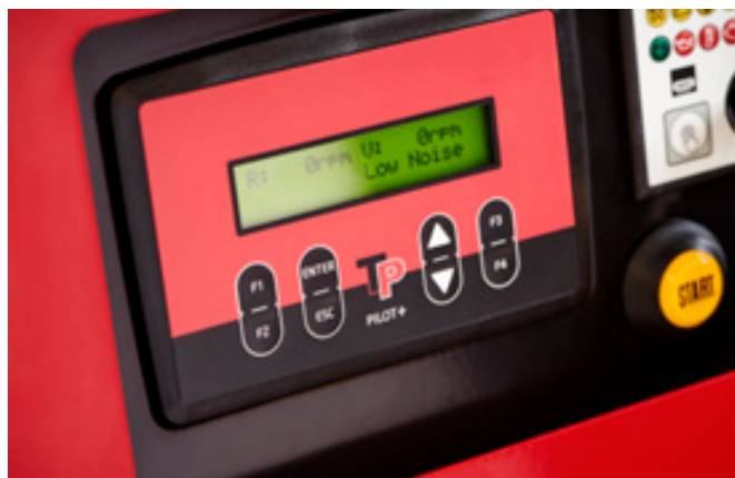
TP Pilot+, eenvoudig in gebruik en toch met uitstekende functies voor dagelijks werk (pagina 17)