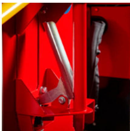
Ergonomisch ontwerp met eenvoudige handgreep voor het snel en veilig draaien van de versnipperaar