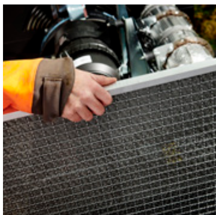
Filter voor eenvoudig schoonmaken