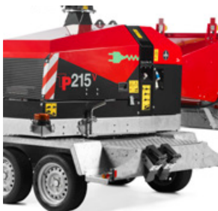
Mechanisch draaiplateau 225° (optioneel)