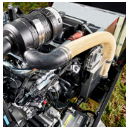
Hatz 4H50 Stage V motor met 55 kW