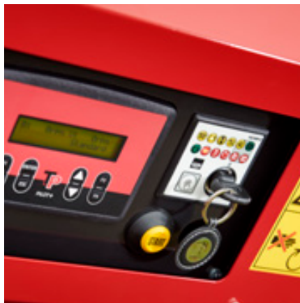
Gebruikersinterface met bediening en TP Starter