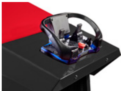
Scanreco afstandsbediening voor flexibiliteit